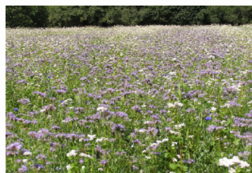
Aménagements favorables aux auxiliaires agricoles